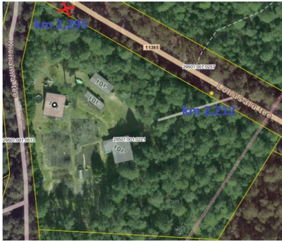
Joonis 1. Riigitee km 2,212 ja 2,295 ristumiskohad. Väljavõte teeregistrist.

Detailplaneeringu lähteseisukohtade (15.05.2023, nr 7.2-2/23/8819-2) punktis 1 oleme esitanud tingimuse: „Juurdepääs moodustatavatele kruntidele lahendada vastavalt DP algatamise eelnõule lisatud kruntide plaanile“, mis oli lisatud Lääne-Harju Vallavalitsuse poolt 19.04.2023 esitatud taotlusele (vt joonis 2). Esitatud planeeringulahenduse põhijoonisel „Lohusalu tee 101 katastriüksuse ja lähiala detailplaneering“ (Osaühing Pilveprojekt, töö nr T1523, joonis DP-4, 10.05.2025) ei ole arvestatud kirja 15.05.2023 nr 7.2-2/23/8819-2 punkti 1 nõuet.